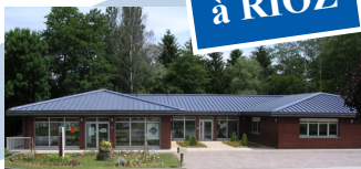
Maison de services au public