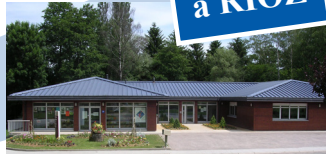
Maison de services au public